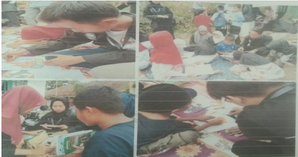
Gambar 2. Kegiatan pojok baca Al-Farabi di desa Asem kec. Cibadak, Lebak Banten

kalangan anak-anak Tingkat anak usia dini dan Tingkat sekolah dasar. Pojok baca seolah menjadi hiburan dan bermain sambil belajar di pojok baca tersebut (lihat gambar 2). Agar minat baca Masyarakat meningkat, maka kedepannya diharapkan pojok baca memiliki kegiatan untuk menstimulus Masyarakat untuk datang dan membaca di pojok baca.