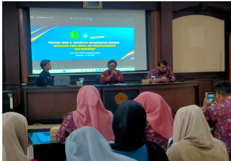
Gambar. 2 Pemaparan materi oleh Pembicara