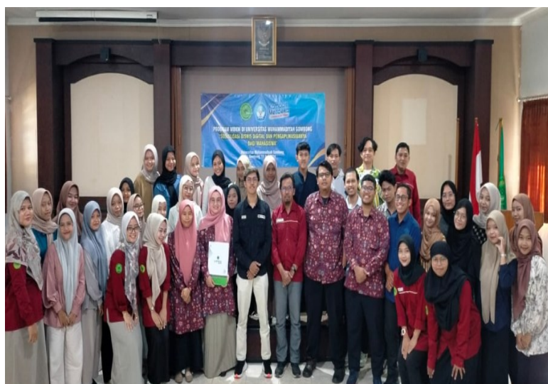
Gambar 4. Peserta Sosialisasi