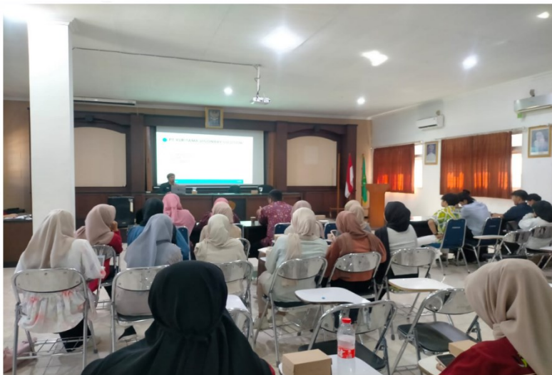
Gambar 3. Pemaparan materi oleh pemateri