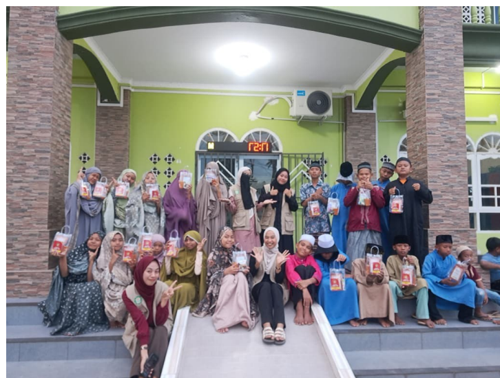
Gambar 3. Foto bersama para peseta KLI.

Dukungan berkelanjutan dari lembaga pendidikan, pengurus masjid, tokoh masyarakat, dan orang tua sangat penting untuk keberlanjutan dan pengembangan Program KLI, sebagai fondasi kelahiran Taman Pendidikan Al-Qur'an (TPA) resmi di Masjid Al-Muttaqin yang mampu secara konsisten membina generasi Qur'ani masa depan.