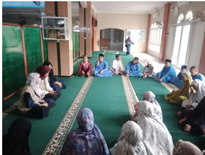
Gambar 1. Pelaksanaan Kelas Literasi Islami di Masjid Al Muttaqin

Kegiatan KLI fokus pada pembinaan tiga aspek utama yakni tahsin, tahfidz, dan pengenalan hadits. Di aspek tahfidz, perkembangan hafalan anak-anak sangat menggembirakan. Tidak hanya menghafal surat-surat pendek dalam juz 'amma, peserta juga diajarkan teknik murajaah atau pengulangan hafalan secara berkala untuk memperkuat daya ingat dan menjaga konsistensi hafalan. Pendekatan ini terbukti efektif dalam membangun motivasi berkelanjutan bagi anak-anak untuk secara aktif menambah hafalan Al-Qur'an. Studi terbaru mendukung pentingnya metode pengulangan hafalan yang konsisten sebagai kunci sukses dalam program tahfidz(4).