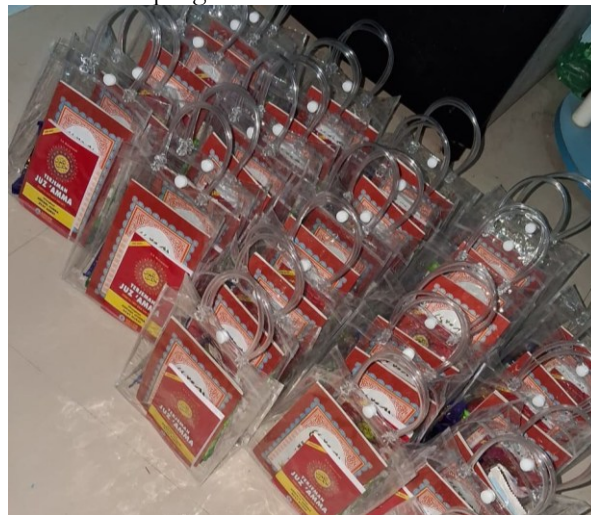
Gambar 2. Buku Panduan Hadits dan Juz Amma yang di gunakan.

Hasil evaluasi menunjukkan peningkatan signifikan dalam beberapa aspek: