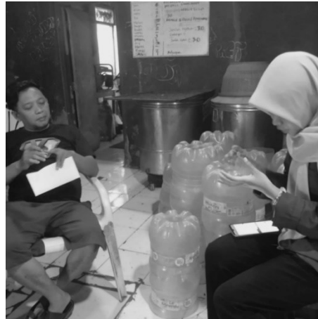
Gambar 2. Pemaparan materi kepada mitra pengabdian.

Hasil dari wawancara menunjukkan bahwa mitra belum menguasai format laporan keuangan dan kurang memahami tentang manfaat laporan laba rugi sebagai bentuk evaluasi usaha. Melihat kondisi tersebut, pengabdian menyiapkan materi tentang pencatatan keuangan laporan laba rugi dalam bentuk PowerPoint, seperti tampak pada Gambar 1. Hasil dari penyampaian materi membantu mitra memahami alur pencatatan keuangan secara sistematis, memahami fungsi dan isi dari laporan laba rugi, serta memahami cara kerja aplikasi secara bertahap. Kegiatan dilanjutkan dengan pelatihan berupa simulasi pencatatan dari transaksi harian menggunakan aplikasi, hingga terbentuk laporan laba rugi yang dapat di aplikasikan dengan mudah, seperti tampak pada Gambar 2.