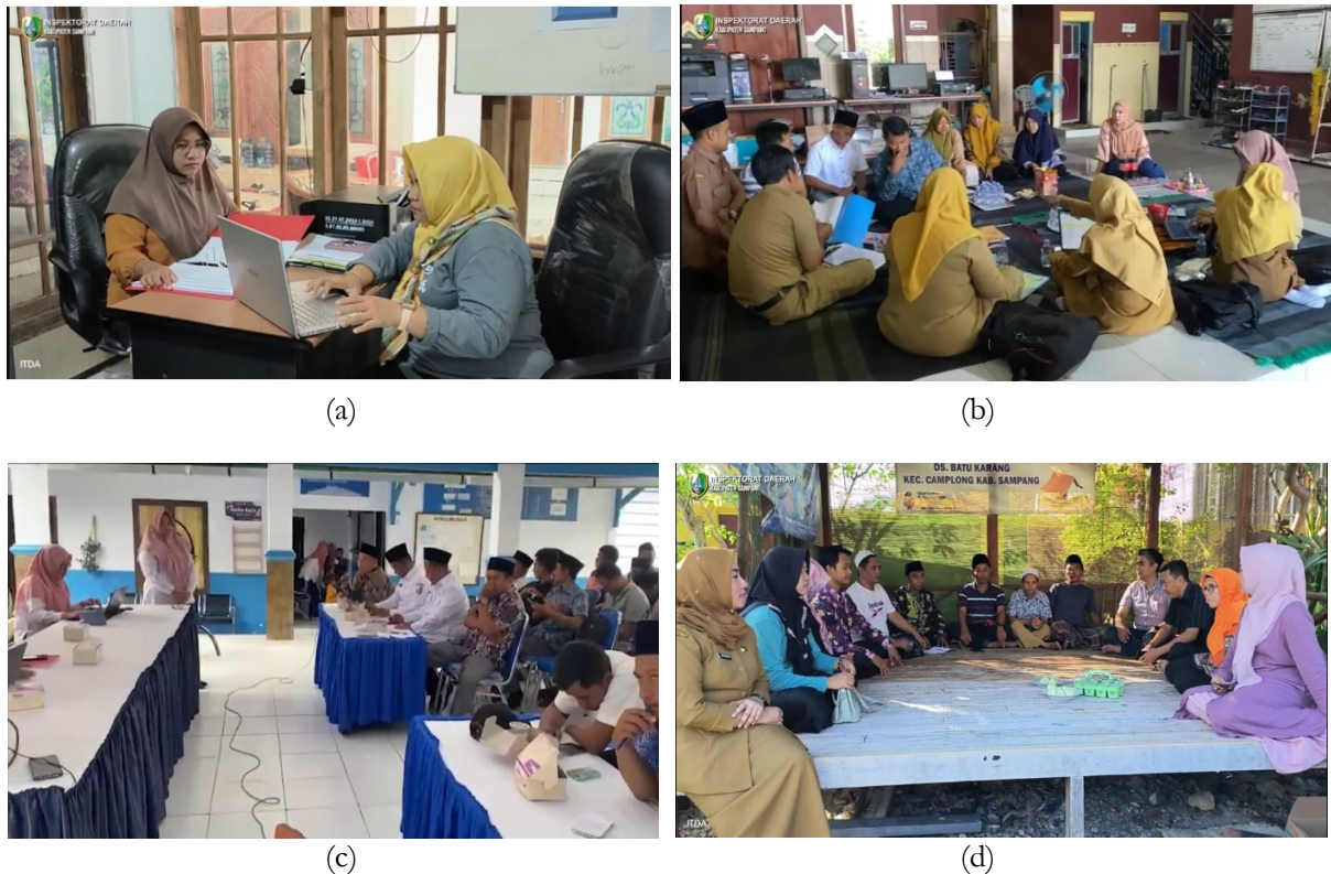
Gambar 2. (a) dan (b) Pelaksanaan asistensi pengelolaan keuangan desa oleh Inspektorat; (c) dan (d) Pelaksanaan pembinaan pengelolaan keuangan desa

Bentuk kegiatan dalam asistensi dan pembinaan pengelolaan keuangan desa diawali dengan proses koordinasi dan perizinan kepada pemerintah desa yang bersangkutan, seperti ditunjukkan pada Gambar 2. Tim pendamping akan diantar langsung ke lokasi desa dan kecamatan terkait, kemudian menerima pengarahan awal dari pihak desa maupun dari Inspektorat sebagai pembina teknis. Dalam pelaksanaannya, tim tidak secara langsung mengerjakan seluruh proses pengelolaan keuangan desa, melainkan memberikan arahan, konsultasi, petunjuk, serta clue terkait bagian-bagian yang perlu diperbaiki atau disesuaikan dengan ketentuan yang berlaku. Pendampingan juga mencakup bantuan dalam melengkapi dokumen-dokumen yang belum dikerjakan oleh pemerintah desa serta membantu memperbaiki proses pengelolaan keuangan agar sesuai dengan prosedur yang berlaku.