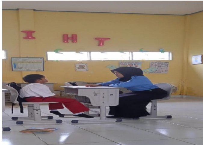
Gambar 2. Foto Dokumentasi pelaksanaan pendampingan metode suku kata

Ekstra membaca awal dengan menggunakan metode suku kata di SD Negeri 49 Palembang untuk kelas 2 dilaksanakan pada pukul 10.30 – 11.30 WIB, seperti pada Gambar 3. Setelah pulang dari jam belajar mengajar di sekolah, anak -anak juga diberikan waktu jeda untuk istirahat selama 15 menit sebelum lanjut untuk menerima materi yang diajarkan. karena anak belajar membaca bersamaan, anak harus mengantri terlebih dahulu. Adanya antrian ini secara tidak langsung mengajarkan anak bersabar dan tertib, dan antrian ini juga dapat menjadi kebiasaan di kehidupan nyata bagi anak (wawancara, 23 September 2024).