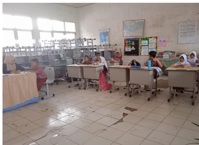
Gambar 3. Anak-anak mengantri untuk membaca

Ekstra membaca awal dengan menggunakan metode suku kata di SD Negeri 49 Palembang untuk kelas 2 dilaksanakan pada pukul 10.30 – 11.30 WIB, seperti pada Gambar 3. Setelah pulang dari jam belajar mengajar di sekolah, anak -anak juga diberikan waktu jeda untuk istirahat selama 15 menit sebelum lanjut untuk menerima materi yang diajarkan. karena anak belajar membaca bersamaan, anak harus mengantri terlebih dahulu. Adanya antrian ini secara tidak langsung mengajarkan anak bersabar dan tertib, dan antrian ini juga dapat menjadi kebiasaan di kehidupan nyata bagi anak (wawancara, 23 September 2024).