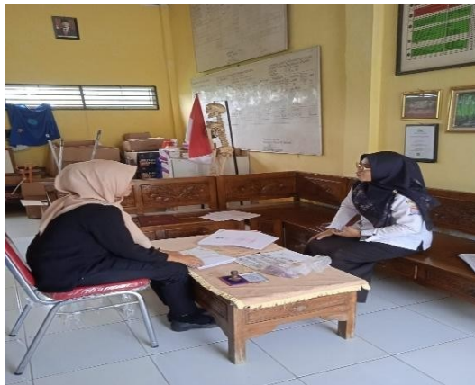
Gambar 5. Proses wawancara terhadap guru kelas