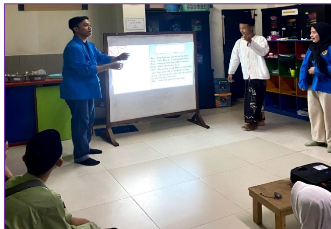
Gambar 3. Praktek Percakapan

Setelah menonton video, peserta didik diminta untuk menirukan percakapan yang ada dalam video tersebut, baik secara individu maupun dalam kelompok. Kegiatan ini membantu peserta didik memperbaiki pengucapan mereka dan memberikan mereka rasa percaya diri setelah berhasil melakukan percakapan tersebut. Pada awalnya, beberapa peserta didik merasa canggung dan ragu untuk berbicara, namun seiring berjalannya waktu, mereka mulai merasa lebih nyaman dan percaya diri karena mereka dapat melihat langsung bagaimana percakapan dalam bahasa Inggris berlangsung secara nyata dan bagaimana mereka bisa mengikutinya.