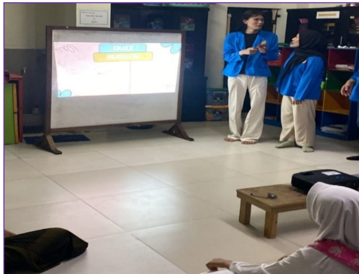
Gambar 4. Quiz Session

Bagaimanapun juga, pada kegiatan PkM ini, para narasumber menggunakan video interaktif sebagai salah satu metode pembelajaran yang efektif dalam meningkatkan kemampuan berbicara para peserta didik. Video percakapan yang menunjukkan interaksi sehari-hari dalam bahasa Inggris memberikan peserta didik contoh nyata tentang bagaimana bahasa Inggris digunakan dalam berbagai situasi, seperti bertanya arah, berbicara tentang cuaca, atau berdiskusi tentang kegiatan favorit. Dengan menonton video tersebut, peserta didik dapat melihat bagaimana penutur asli bahasa Inggris berbicara, mengamati cara pengucapan dan intonasi yang digunakan dalam percakapan sehari-hari.