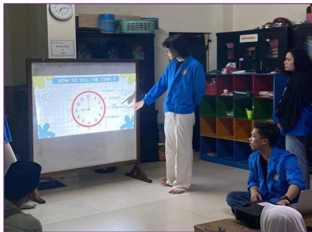
Gambar 2. Pemaparan materi bertema “Time”

Setelah mengikuti beberapa sesi pelatihan yang menggunakan video sebagai media pembelajaran, terlihat adanya perubahan yang signifikan. Berdasarkan observasi yang dilakukan selama pelatihan, banyak peserta didik yang mulai merasa lebih nyaman dan percaya diri ketika diminta untuk berbicara. Mereka mulai berani mengungkapkan pendapat mereka dalam bahasa Inggris, meskipun terkadang masih dengan pengucapan yang tidak sempurna. Kepercayaan diri ini sangat penting, karena berbicara adalah keterampilan yang membutuhkan latihan berulang-ulang dan dorongan untuk terus mencoba.