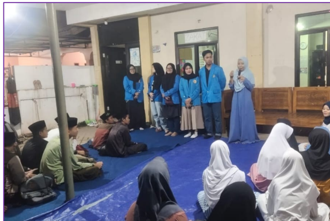
Gambar 1. Motivasi oleh narasumber

Narasumber memberikan penjelasan sekaligus memotivasi peserta didik tentang betapa pentingnya belajar bahasa Inggris selain agar dapat berkomunikasi dalam kehidupan sehari-hari, juga agar dapat berkompetisi di era global kemudian hari. Narasumber pun memberikan contoh-contoh keadaan dimana seseorang perlu memiliki pengetahuan dan kemampuan dasar berbahasa Inggris, dalam hal ini adalah kemampuan berbicara. Penjelasan ini pun mendapat feedback positif dari peserta didik hingga menunjukkan rasa keingintahuan lebih mendalam dengan memberikan beberapa pertanyaan kepada narasumber terkait hal-hal yang dapat dilakukan untuk meningkatkan kemampuan berbicara bahasa Inggris mereka.