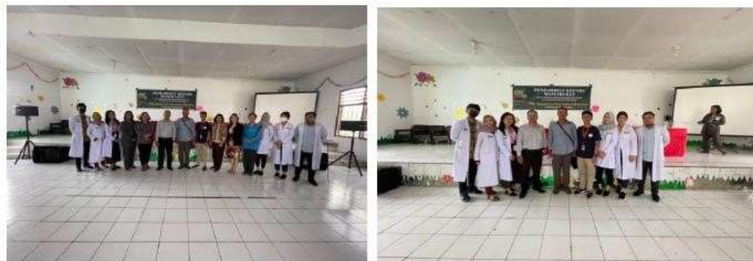
Gambar 4. Kegiatan Foto Bersama