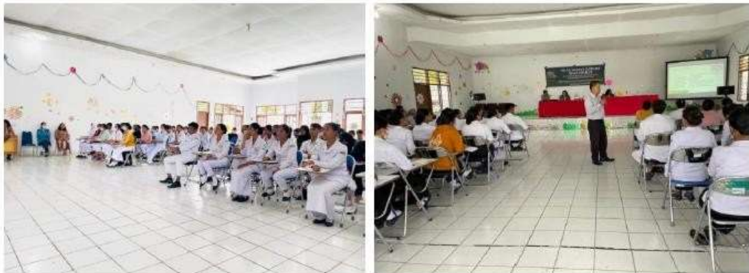
Gambar 3. Kegiatan Sosialisasi