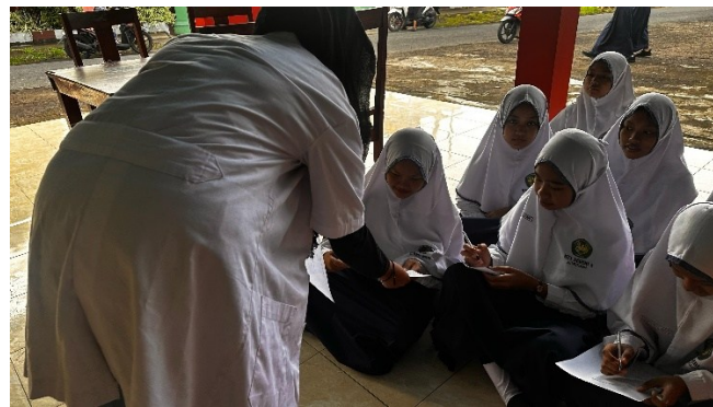
Gambar 2. Pengisian kuesioner.