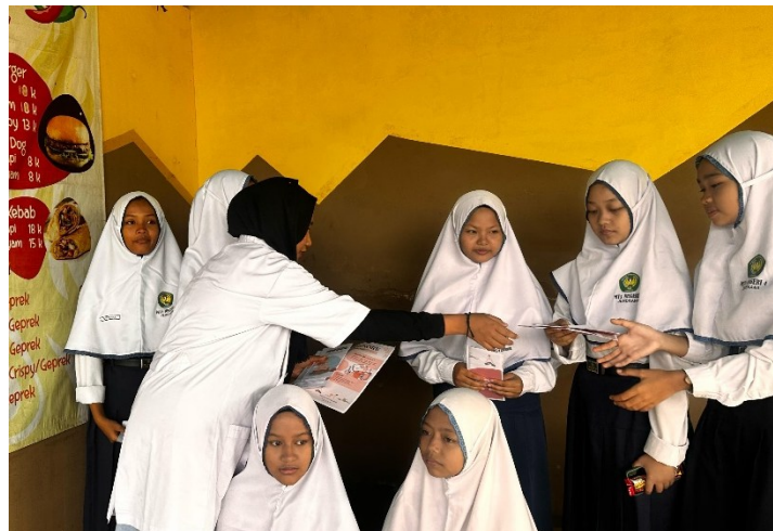
Gambar 5. Pembagian leaflet disminore