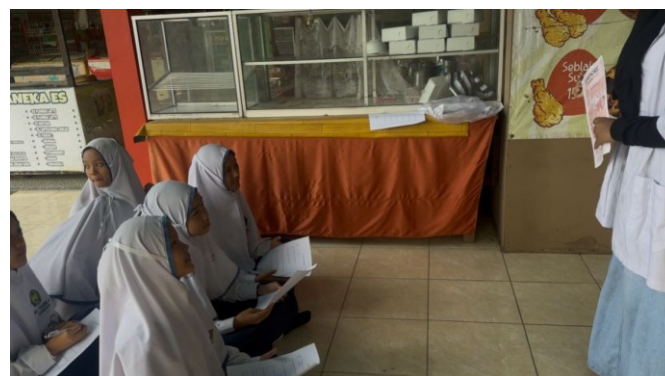
Gambar 3. Edukasi mengenai dismenore.