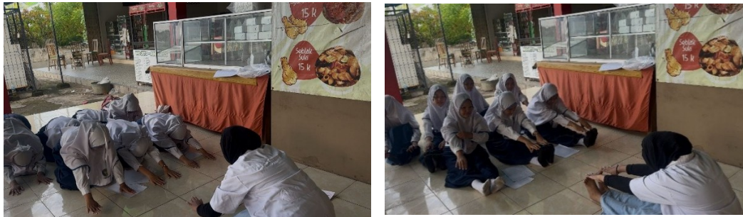
Gambar 4. Latihan untuk disminore.