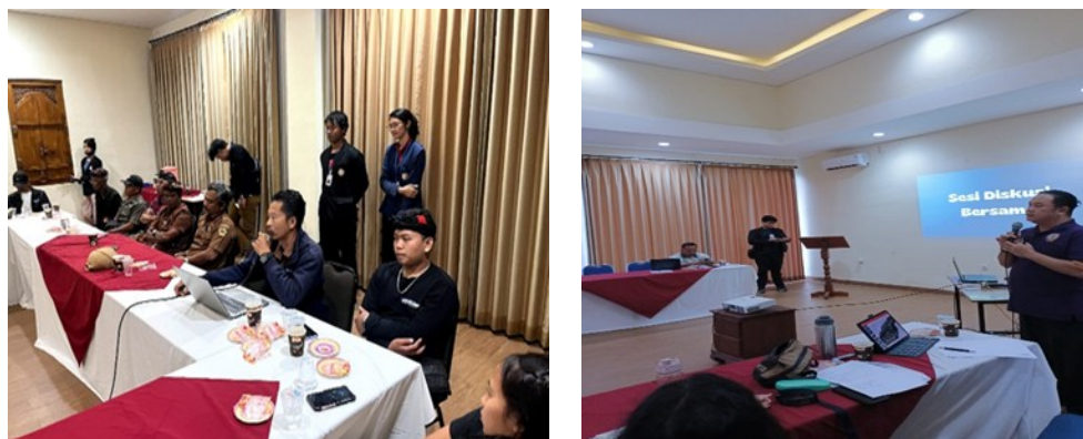
Gambar 2. Kegiatan Focus Group Discussion