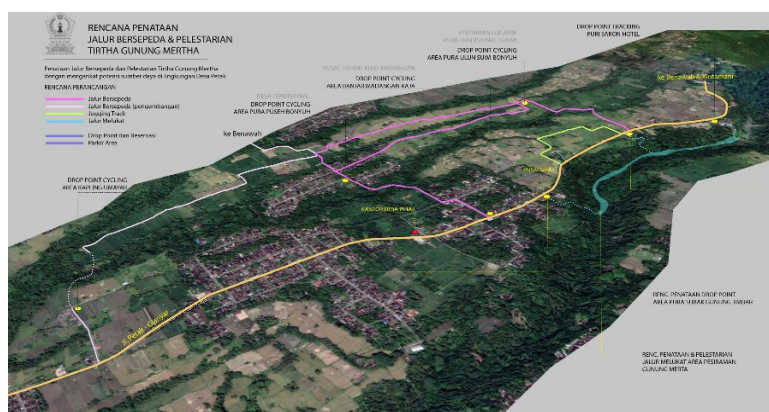
Gambar 3. Rencana Pengembangan Pariwisata Desa Petak

Perencanaan yang dibuat untuk masing-masing dusun ditujukan agar pengembangan potensi wisata saling terkait dengan semua dusun yang terdapat di Desa Petak sehingga masyarakat dapat menikmati hasil dari pengembangan desa wisata secara menyeluruh. Terkait dengan pengelolaan, aspek pengorganisasian dan pengawasan juga diperlukan dalam pengembangan pariwisata di Desa Petak. Perencanaan pengembangan pariwisata juga mencakup aspek pelestarian sumber daya budaya sehingga diharapkan dampak negatif yang ditimbulkan dapat diminimalisir.