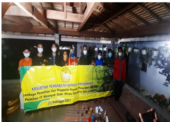
Gambar 5. Focus Group Discussion