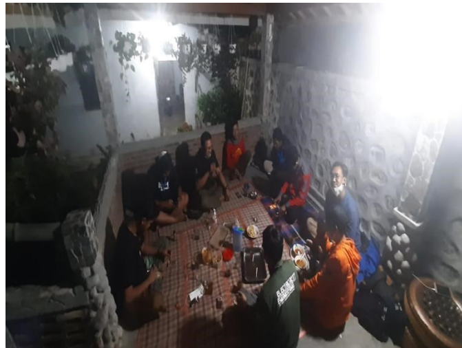
Gambar 4. Focus Group Discussion