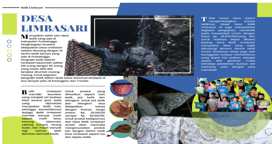
Gambar 2. Majalah Sebagai Promosi Desa Limbari