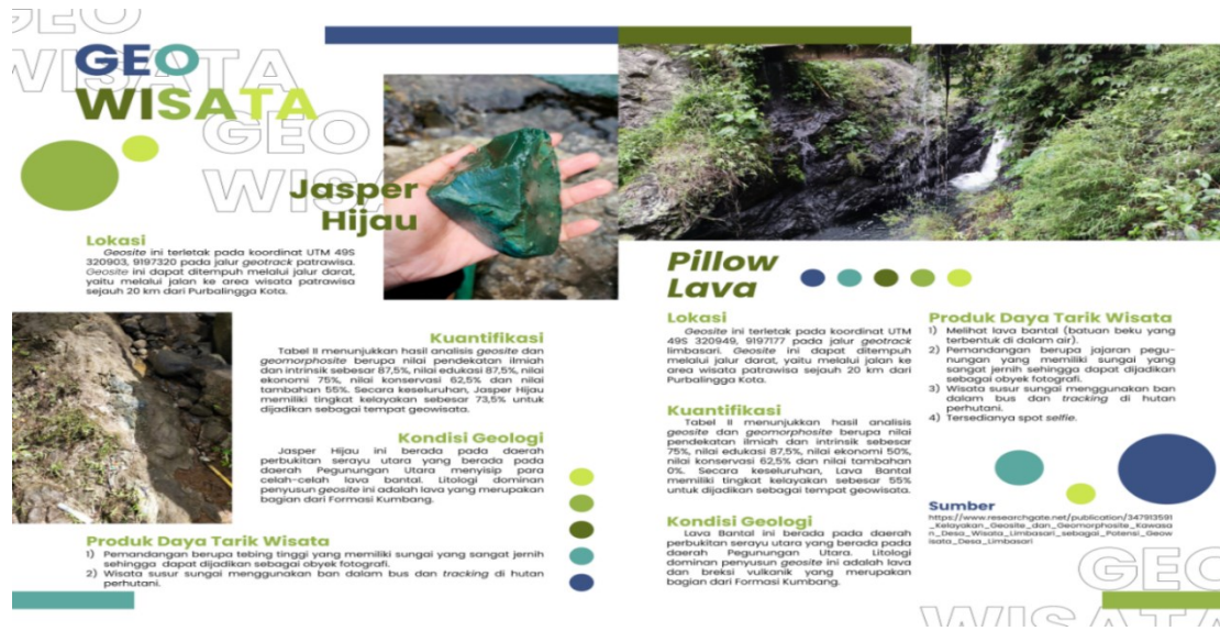
Gambar 3. Majalah Sebagai Promosi Desa Limbari