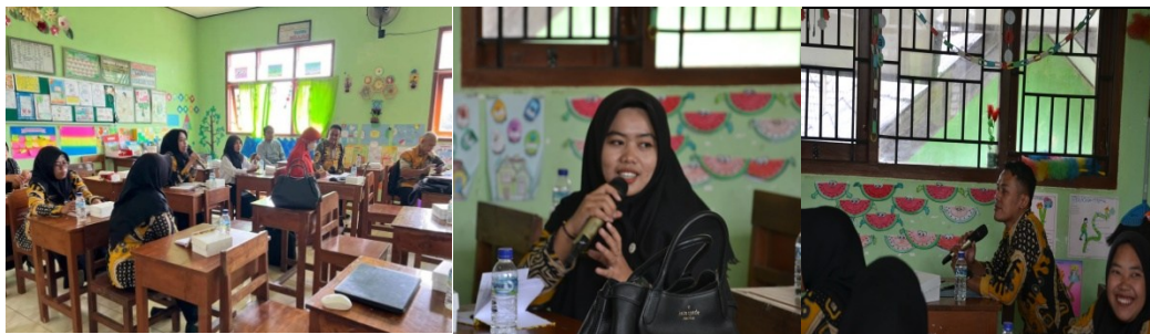
Gambar 1 . Tanya jawab, sharing dan diskusi

Setelah sosialisasi dan pelatihan dilaksanakan tanya jawab, sharing dan diskusi tentang implementasi pembelajaran berdiferensiasi di kelas. Dari tanya jawab, sharing dan diskusi dapat menambah wawasan guru-guru untuk dapat mengimplementasikan pembelajaran berdiferensiasi di kelas secara lebih efektif dan menyenangkan.