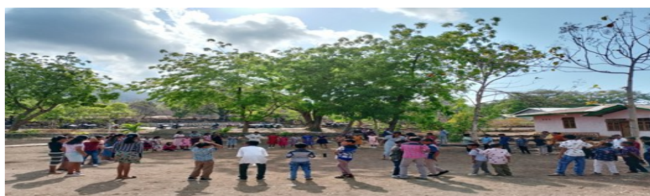
Gambar 2 Pendampingan Anak Sekami

Kegiatan pendampingan iman seperti tampak pada Gambar 2 anak ini dilakukan untuk bertujuan menumbuh kembangkan iman anak sejak usia dini ditengah krisis iman. Kegiatan ini biasanya dilaksanakan pada setiap hari minggu selesai misa pertama. Banyak apresiasi dari Pihak Stasi maupun umat sebab kegiatan ini penting untuk mendampingi anak sekami di Stasi Nusadani sudah 2 tahun terakhir tidak berjalan. Hal ini menjadi masalah sehingga kehadiran peserta PKM dan bekerja sama dengan animator-animatris stasi untuk menghidupkan kembali kegiatan ini. Banyak orang tua anak atau umat stasi merasa senang karena anak-anak mereka bisa dibina dan dilatih menjadi anggota gereja sejak dini.