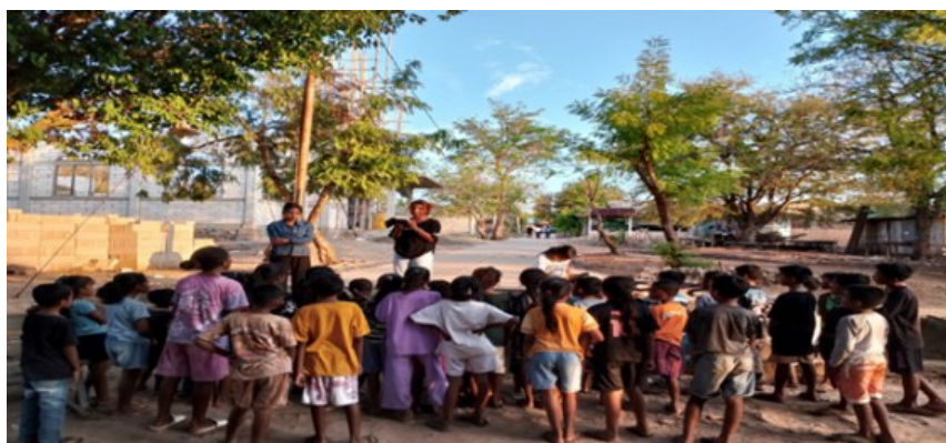
Gambar 6 Pendalaman Teks Kitab Suci dengan Anak Sekami

Pendalaman kitab suci, seperti tampak pada Gambar 6 merupakan salah satu cara mengenalkan isi kitab suci sebagai sumber keimanan dan inspirasi hidup bagi anak. Lebih spesifiknya, tujuan Pendalaman kitab suci ini adalah untuk meningkatkan rasa percaya diri dan keberanian anak dalam mengungkapkan pengalaman keagamaannya berdasarkan kitab suci. Agar anak-anak seperti kita mengetahui dan memahami Kitab Suci serta mencintainya dalam kehidupan sehari-hari (8).