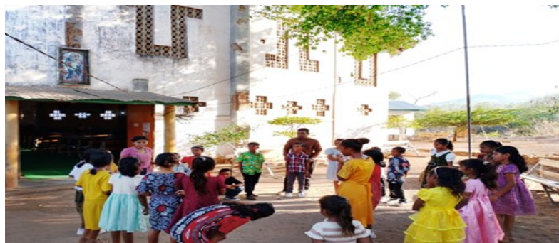
Gambar 4 Permainan Edukatif Bersama Anak Sekami

Permainan edukatif merupakan salah satu sarana pembelajaran yang sangat diapresiasi dan sangat disukai anak-anak karena memadukan hiburan dan pendidikan, sebagaimana seperti pada Gambar 4.