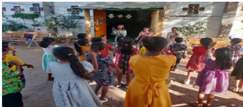
Gambar 5 Permainan Edukatif Bersama Anak Sekami

Bernyanyi untuk anak sangat diperlukan mengembangkan bicara dan dapat menimbulkan rasa percaya diri serta keberanian, seperti pada Gambar 5. Dalam kegiatan bernyanyi dan bergoyang lagu-lagu sekami ini sangat membantu anak-anak sekami untuk tetap bersemangat dalam mengikuti kegiatan sekami dan membantu mereka untuk lebih cepat mengerti dan memahami ajaran gereja katolik dalam lirik lagu sekami yang didengarkan. Dan ini juga salah satu perwujudan dalam meningkatkan iman anak.