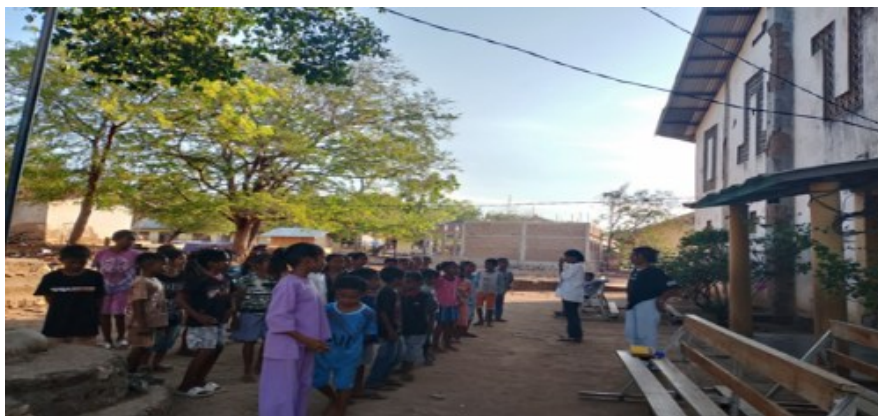
Gambar 3 Doa Bersama Anak Sekami

Doa bersama adalah doa yang dipanjatkan secara bersama-sama seperti tampak pada Gambar 3 dilakukan oleh anak-anak dan penghibur kita sebagai wujud persatuan karena mereka sudah terbiasa dengan kebaikan dan kehadiran Tuhan di tengah-tengah mereka. Doa bukanlah suatu pekerjaan yang sia-sia, namun sebaliknya seseorang dapat memperoleh rahmat yang berlimpah dari Tuhan melalui doa. Tujuan berdoa bersama adalah untuk melibatkan Tuhan dalam segala rencana dan kegiatan hidup mereka. Mereka menyerahkan segala pergumulan hidup mereka demi kuasa dan kemaslahatan Tuhan. Dengan kebiasaan ini, hidup menjadi lebih bermakna. Kebiasaan doa bersama, sangat membentuk kepribadian iman sebagai orang katolik. Doa bersama ini sebagai salah satu perwujudan untuk meningkatkan dan mengembangkan iman anak itu sendiri. Doa bersama ini biasa dilakukan pada saat sebelum dan sesudah melakukan kegiatan sekami dengan tujuan untuk mengajarkan anak sekami agar pentingnya berdoa sebelum dan sesudah dalam melakukan suatu aktifitas.