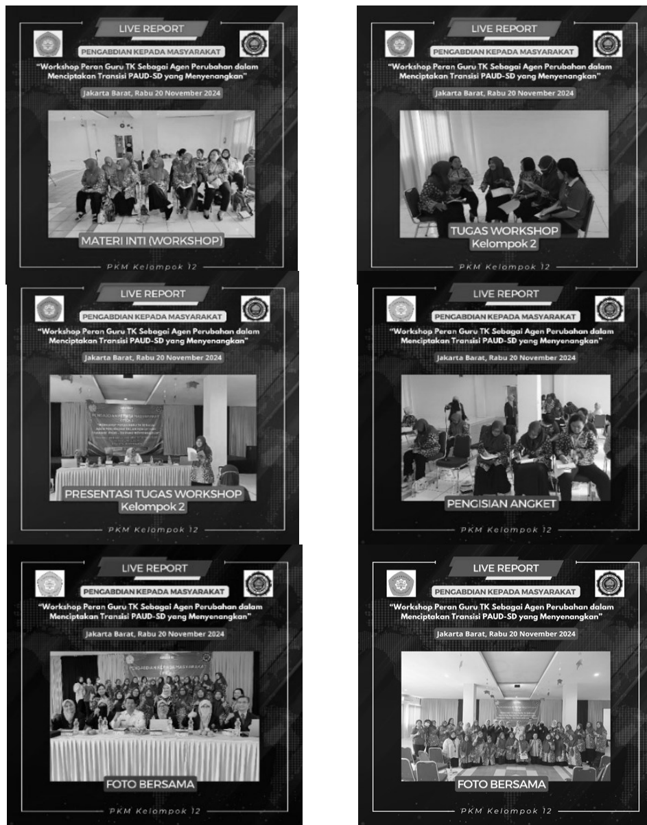
Gambar 3. Kegiatan Workshop Peran Guru TK Sebagai Agen Perubahan dalam Menciptakan Transisi PAUD-SD yang Menyenangkan