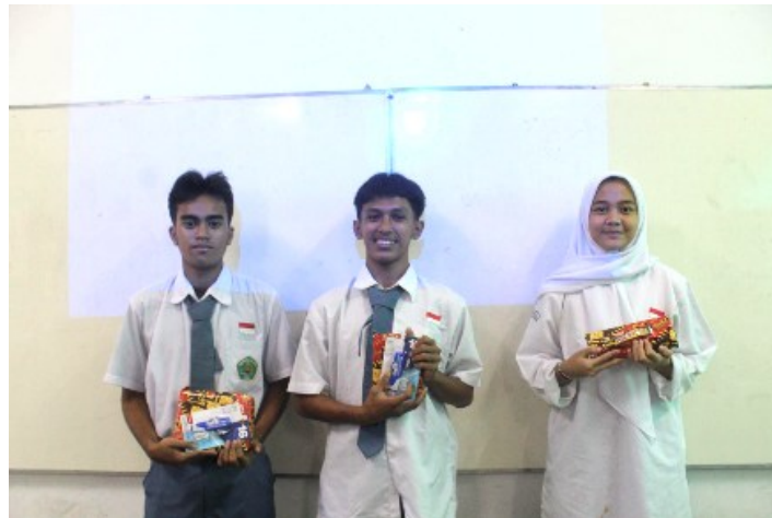
Gambar 6. Peraih skor 3 tertinggi melalui aplikasi Kahoot.