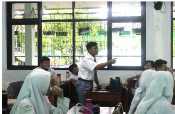
Gambar 3. Sesi Tanya Jawab.

Secara keseluruhan, kegiatan sosialisasi edukasi kesadaran gen z dalam membangun nilai toleransi di MAN 2 Jakarta mendapatkan banyak respon yang positif. Metode dan materi yang digunakan sangat bermanfaat dalam meningkatkan pengetahuan mengenai pentingnya toleransi. Hasil ini memberikan gambaran positif berupa wawasan yang sangat berharga untuk peningkatan program di masa depan. Kegiatan ini dirancang untuk memenuhi kebutuhan siswa dalam menghadapi tantangan keberagaman di lingkungan sekitar. Kegiatan ini bertujuan untuk menumbuhkan kesadaran akan pentingnya menghargai perbedaan dan menjaga hubungan yang harmonis. Melalui pemahaman yang lebih mendalam mengenai nilai toleransi, kegiatan ini diharapkan dapat memberikan manfaat yang signifikan bagi peserta didik, meningkatkan pemahaman antarindividu maupun antarkelompok, serta menciptakan lingkungan yang damai.