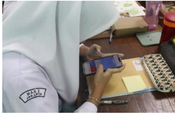
Gambar 5. Peserta didik bermain permainan pada permainan Kahoot.

orang dengan perolehan poin tertinggi pada games Kahoot seperti tampak pada Gambar 6. Kami berharap penghargaan ini dapat menjadi motivasi untuk terus semangat berpartisipasi dalam kegiatan-kegiatan selanjutnya.