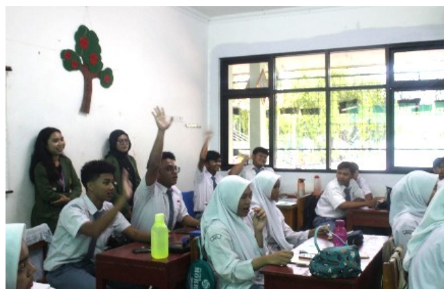
Gambar 4. Sesi Diskusi.

Kegiatan sosialisasi dan edukasi, seperti tampak pada Gambar 3 dan Gambar 4 mengenai kesadaran gen z di MAN 2 Jakarta, yang berfokus pada siswa, berhasil memberikan pemahaman yang mendalam mengenai makna toleransi, dampak negatif dari intoleransi, peran gen z, serta upaya untuk mewujudkan Indonesia yang lebih toleran. Dengan pendekatan interaktif melalui sesi tanya jawab dan diskusi, siswa tidak hanya menerima informasi, tetapi juga terlibat secara aktif dalam proses pembelajaran. Pendekatan ini diharapkan dapat mendorong peserta didik untuk menerapkan nilai-nilai toleransi dalam kehidupan sehari-hari.