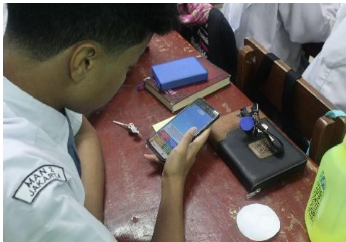
Gambar 1. Peserta didik sedang mengerjakan games melalui aplikasi Kahoot.

karena mengingat data dari GoodStats menunjukkan bahwa mayoritas populasi Indonesia saat ini didominasi oleh kelompok usia tersebut (7). Dengan demikian, gen Z memegang peranan strategis dalam menentukan arah masa depan Indonesia. Tampak seperti Gambar 1 kegiatan ini diawali dengan pengisian pre-test , lalu penyampaian materi secara mendalam yang mencakup nilai-nilai toleransi, dampak negatif jika bersikap intoleransi, hubungan antara toleransi dan keberagaman di Indonesia, serta peran generasi Z dalam mewujudkan Indonesia yang lebih toleran di masa depan. Materi ini diharapkan dapat memberikan landasan yang kokoh sekaligus meningkatkan kesadaran akan pentingnya penerapan sikap toleransi dalam kehidupan sehari-hari. Selain itu, kegiatan ini juga dilengkapi dengan permainan edukatif melalui media aplikasi Kahoot berisikan 20 soal, yang dirancang untuk memperkuat pemahaman peserta didik mengenai nilai-nilai toleransi. Permainan tersebut disusun sedemikian rupa untuk menguji pengetahuan mereka tentang toleransi, sekaligus menciptakan suasana yang lebih interaktif, menyenangkan, dan kompetitif.